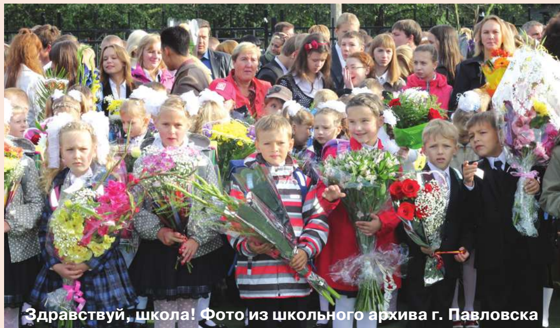
Здравствуй, школа!