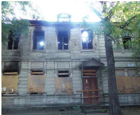
ул. Васенко, 8