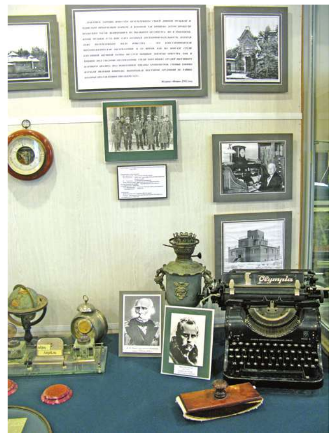
Фрагмент музейной экспозиции.

Вот уже десять лет музей выполняет функцию образовательного учреждения. Его архивы открыты для школьников, работающих над рефератами, посвященными истории города. За долгие годы музей стал базой для проведения конференций, связанных с юбилейными датами города, всей страны. Музей является площадкой для проведения конкурсов, таких