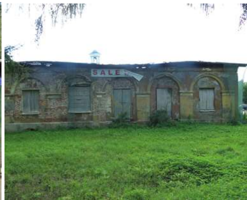
ул. Госпитальная, 2