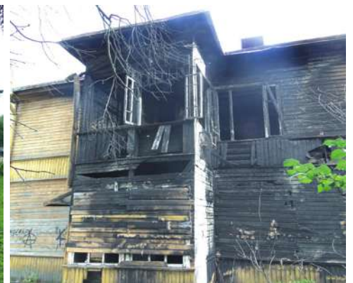
ул. Конюшенная, 20