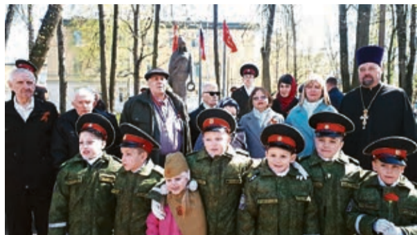
Ораниенбауме, исторический парк «Россия — моя история».

Очень любят наши ветераны бывать на экскурсиях. Только в этом году они посетили город Кронштадт с Морским собором, Пулковскую обсерваторию, Китайский дворец в