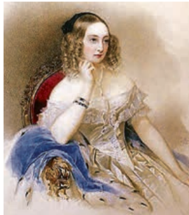
В.И. Гау. Портрет великой княгини Елены Павловны. 1840 г.