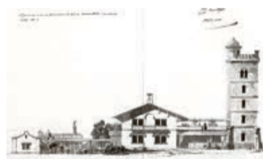
А.П. Брюллов. Фасад собственного дома в Еленинском квартале на месте под №1. 1837 г.

фигурным шипцом и имитацией каменной кладки по углам. Флигель этот уходил в глубину участка, где почти смыкался с другим одноэтажным флигелем, имевшем на первом плане галерею, уходившую в сторону второго, главного дома.