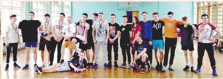
Команды, занявшие 3-е и 4-е места

Поздравляем победителей, их тренеров и наставников, желаем новых спортивных побед и достижений! Отдельные слова благодарности – местной администрации города Павловска за хорошо организованные мероприятия и предоставленные призы.