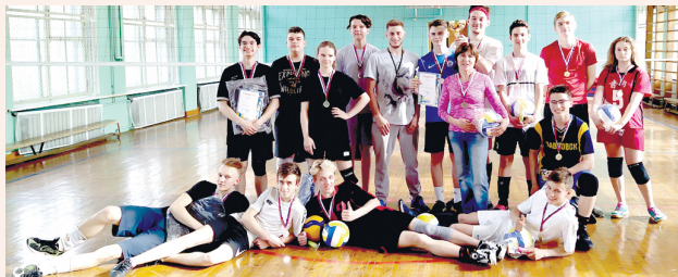
Команды, занявшие 1-е и 2-е места

От местной администрации города Павловска команды, занявшие первые места, были награждены кубками, все члены команд-победительниц получили медали и призы, а члены команд-участниц турнира – поощрительные призы.