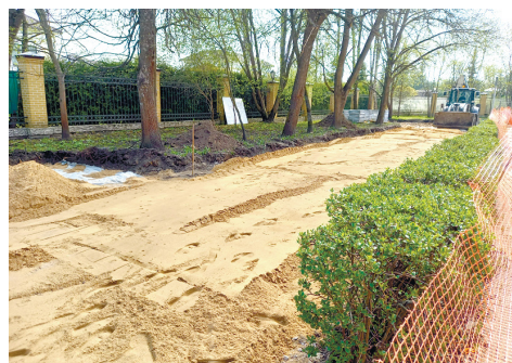
Идут работы на ул. Обороны, д. 8