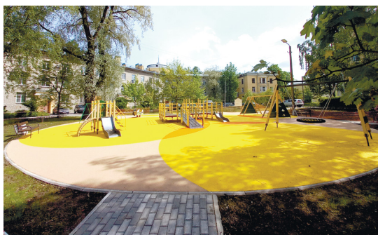
ул. Детскосельская, д. 1/2