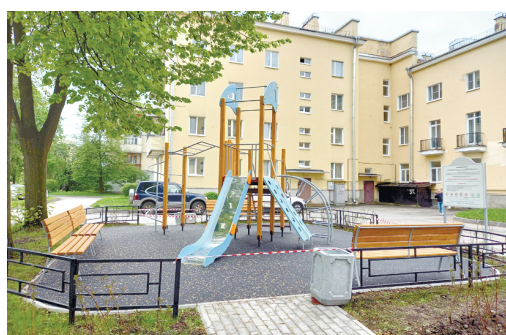
ул. Слуцкая, д. 4