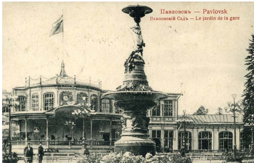
Павловский музыкальный вокзал