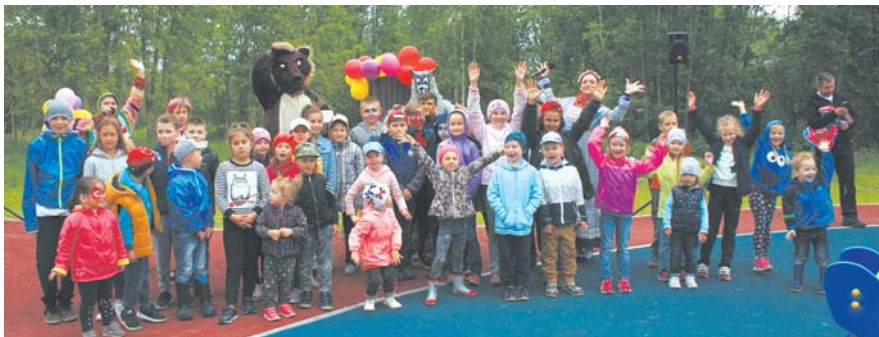
Представление в Грачевке