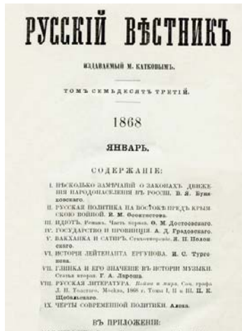
Журнал «Русский вестник» № 1 за 1868 год, в котором начал печататься роман «Идиот»

Сам роман предоставляет нам очень скудные, но не безнадежные подсказки. Первое, на что следует обратить внимание: «Идиот» был написан в 1867–1869 годах за границей, вдали от Павловска, так что автор, приводя описания