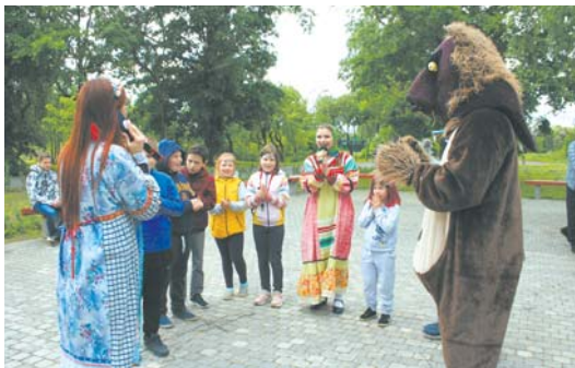
Праздник в Динамо