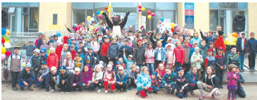
Праздник на Песчаном пер.