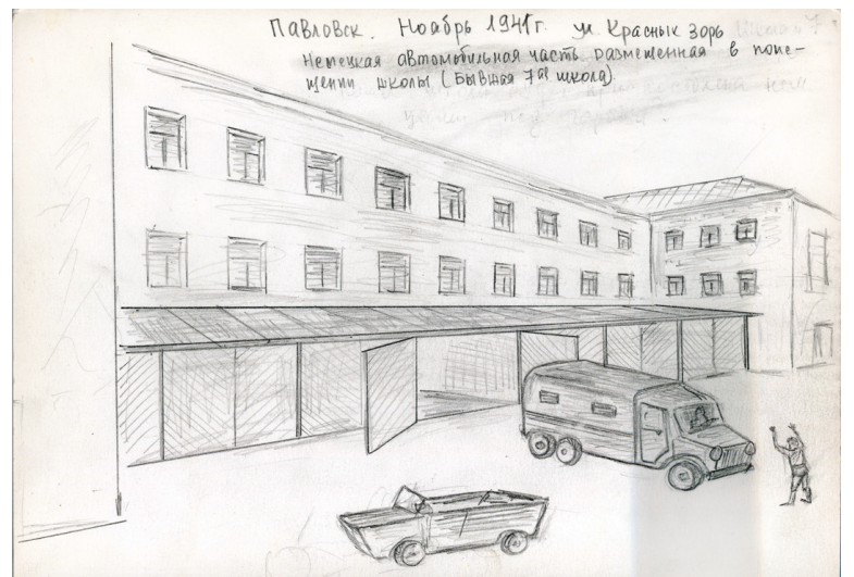
А.И. Нефедов. Гаражи немецкой автомобильной части, размещившейся в здании школы № 7 во время немецкой оккупации. Рисунок по памяти. Ноябрь 1941 года