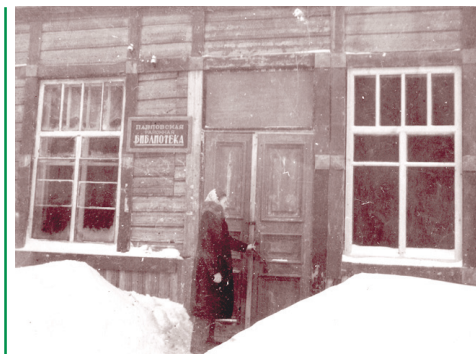
Библиотека в 1949 г.

Беседовала Марина ОРЛОВА