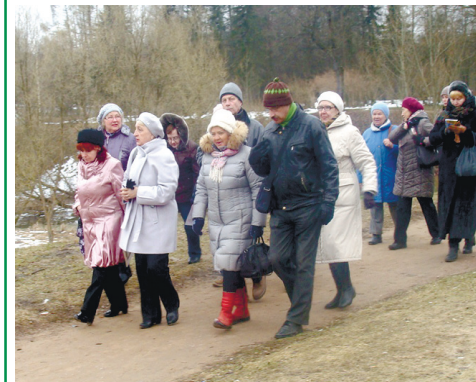
Путешествие в историческое прошлое Павловска. Пешеходная экскурсия. Библионочь. 2017 г.