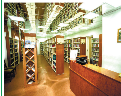
Современный зал библиотеки