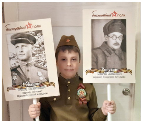
Школа № 464. Никто не забыт. Ничто не забыто