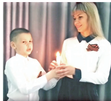
Школа-интернат №8, флешмоб "Свеча Памяти"