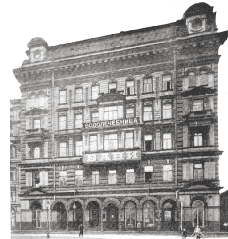
“Егоровские” бани в Большом Казачьем переулке.