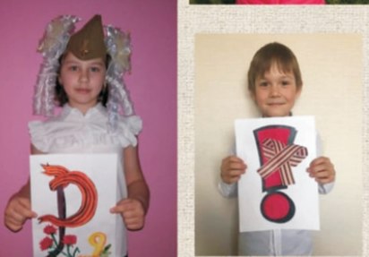
Школа №638. Я помню! Я горжусь!