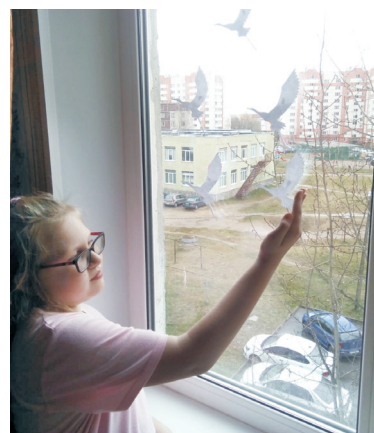
Школа-интернат №8, акция "Летят журавли..."

городского конкурса-фестиваля музыкально-художественного творчества "Русская матрешка".