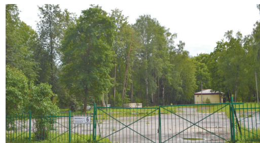
Территория бывшего павловского рынка на улице Гуммолосаровской, д. 6