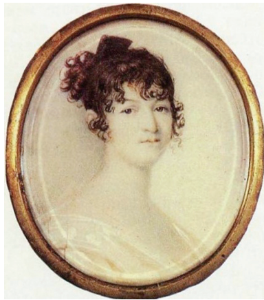
Ксавье де Местр. Надежда Осиповна Пушкина (урожденная Ганнибал). 1810