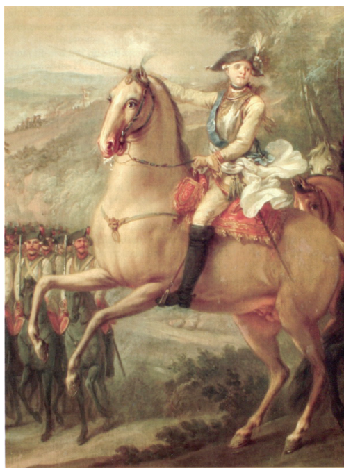
Стефано Торелли. Цесаревич Павел Петрович на маневрах лейб-гвардии Кирасирского полка. 1778–1779

Легко сказать – вернуться на родину, где тебя никто не ждет после двадцати одного года службы и с расстроенным здоровьем начинать с нуля заниматься крестьянским хозяйством. Кроме того, на отставника унтер-офицера, служившего в гвардейском полку, налагались дополнительные ограничения: