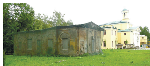
Дом № 2/19 на улице Госпитальной