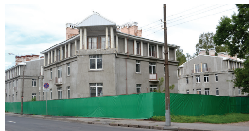
Дом № 20 на улице Госпитальной