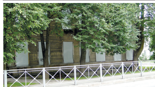
Дом № 17 на улице Васенко