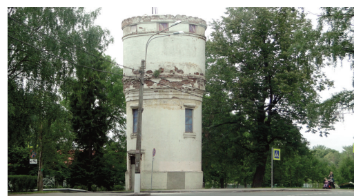
Бывшая водонапорная башня на ул. Слуцкой