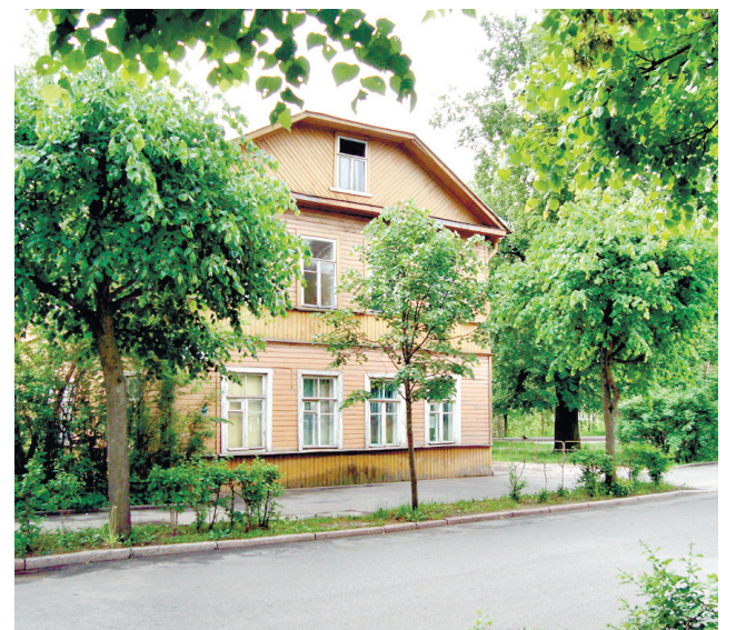
ул. Конюшенная, 20. 1990-е годы