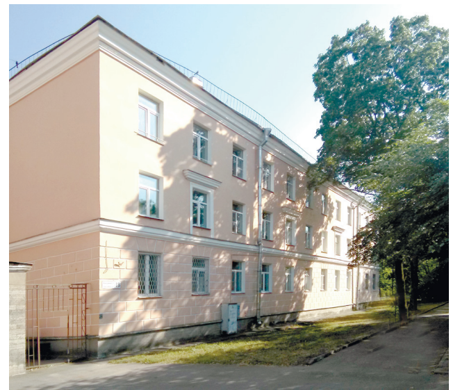
ул. Конюшенная, 18. Современное фото