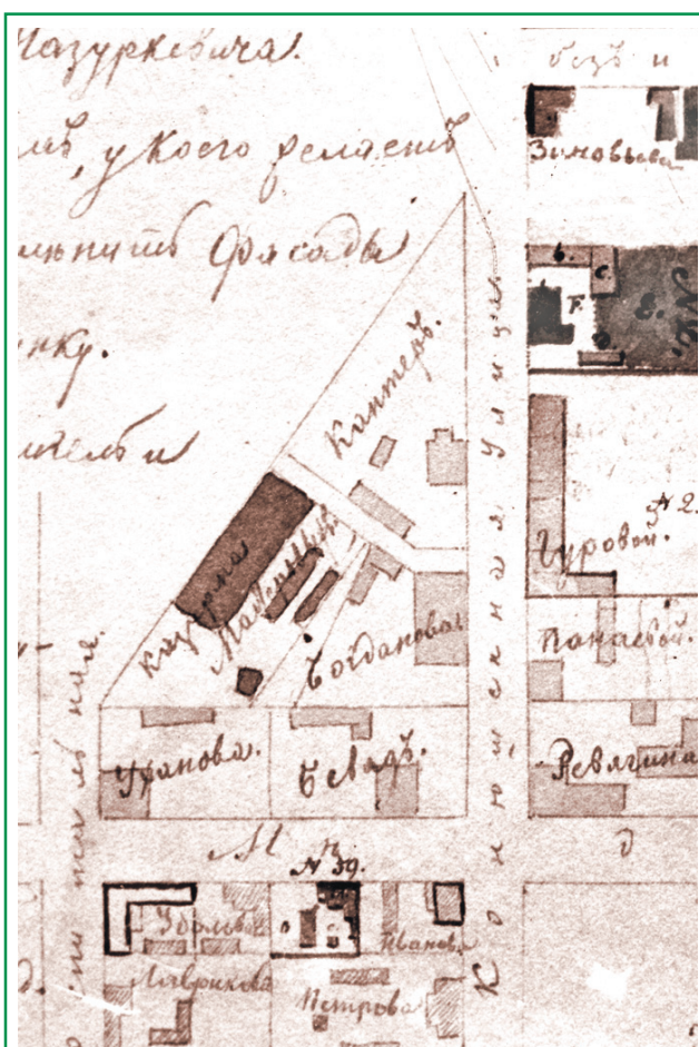
Фрагмент плана Павловска. 1840-е годы

Сергей ВЫЖЕВСКИЙ, Музей истории города Павловска (ЦККД "Павловск") Продолжение следует