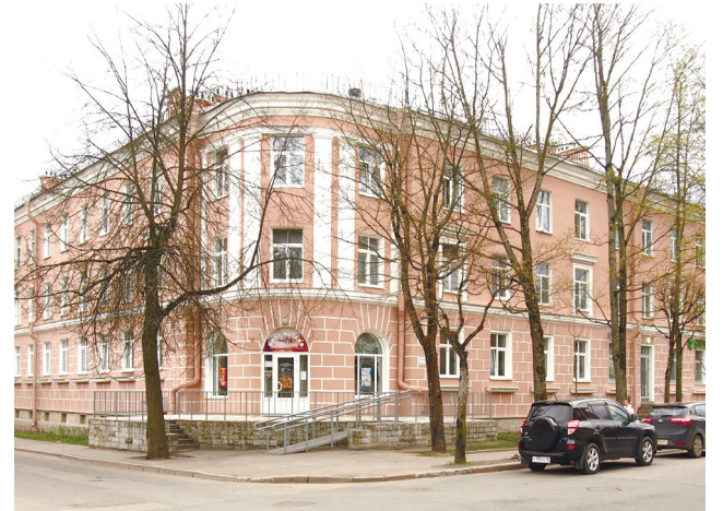
ул. Конюшенная, 16/13. Современное фото