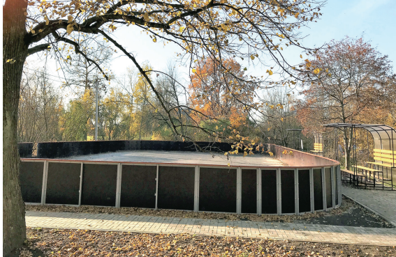
Динамо, хоккейная площадка

и балконы. Не отстают от жителей учреждения и организации, многие из которых также благоустраивают прилегающие территории. Ежегодно мы проводим конкурс по благоустройству по нескольким номинациям. Приятно, что количество заявленных участников год от года растет. Итоги нынешнего конкурса будут подведены к 12 декабря. Многих ждут ценные призы, а самые отличившиеся будут приглашены для вручения наград на торжественное собрание в честь дня рождения Павловска.