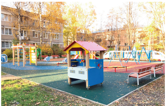
Лебединая ул., д. № 10