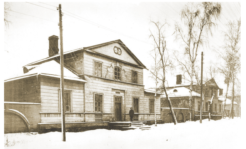
Инвалидные домики "Монмартр". Фото до 1941 года

Когда стадион "Олимпиец" реконструировали к чемпионату мира, были опасения, что вместе с новым строительством будет уничтожена память о прошлом этого места. Но все обошлось. Были проведены археологические раскопки, выявлены фундаменты и госпиталя, и "Монмартра", и новые постройки не затронули эти бесценные объекты, признанные археологическими памятниками. Жаль только, что в проектах новых зданий на стадионе не были учтены проекты В. Бренны и К. Росси, которым можно было бы легко найти новое применение.