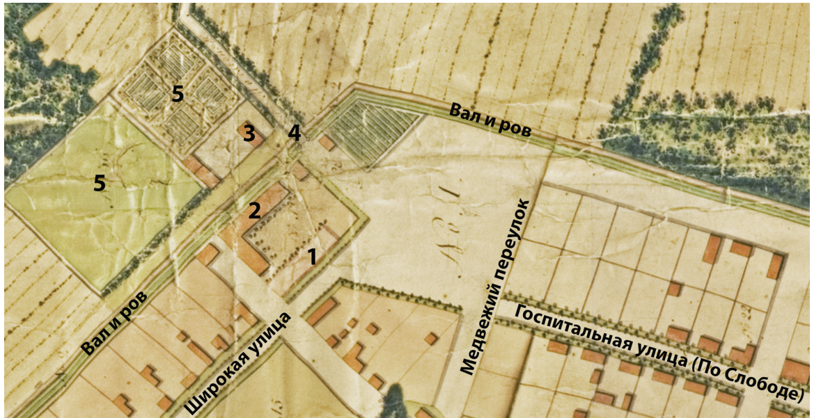
Фрагмент плана Павловского села 1793 года: 1 – госпиталь (В. Бренны); 2 – военный госпиталь; 3 – дом штаб-лекаря В.И. Ритмейстера; 4 – въезд в Павловское село; 5 – сад и огород В.И. Ритмейстера

Поселившиеся в "Монмартре" ветераны составляли команду под названием "Собственный инвалид". В утвержденном Марией Федоровной Положении устанавливалось: