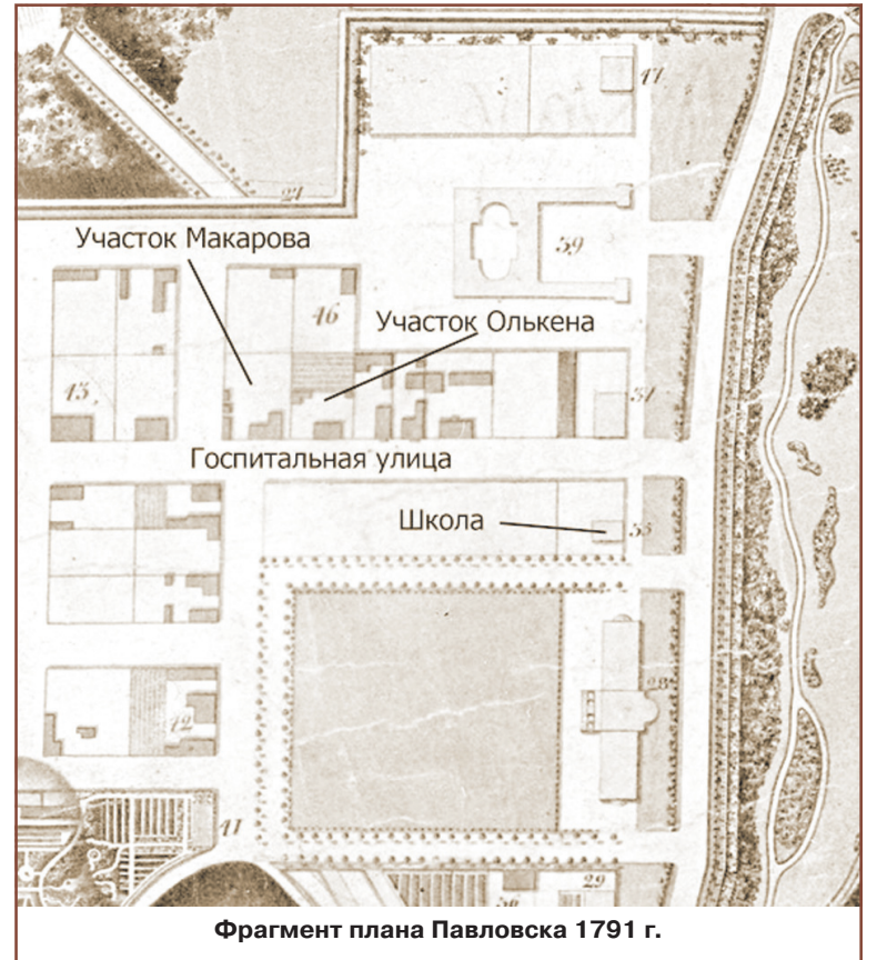
Фрагмент плана Павловска 1791 г.

Все бывшие владения Крашенинниковых (за исключением участка Васильева) приобретает