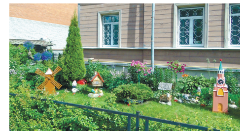
ул. Васенко, 13

смотр-конкурса на лучшее оформление объектов городской среды. В 2017 году в конкурсе приняли участие 65 жителей и 4 учреждения. На конкурс было представлено 14 новых объектов.