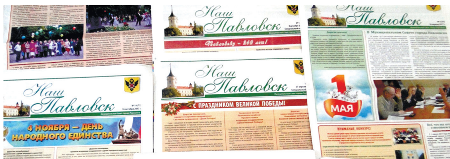
ГРАФИК ПРИЕМА ГРАЖДАН ДЕПУТАТАМИ МУНИЦИПАЛЬНОГО СОВЕТА ГОРОДА ПАВЛОВСКА ПЯТОГО СОЗЫВА НА 2018 ГОД