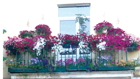
ул. Детскосельская, 17

Ежегодно местная администрация города Павловска организует проведение