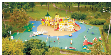
Детская площадка у Купального пруда