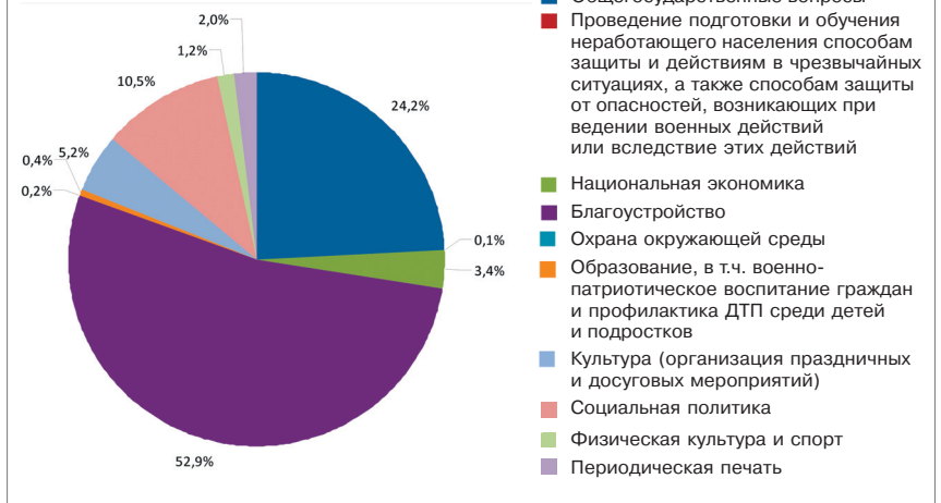
Расходы бюджета за 2017 год

В 2017 году было заключено 135 муниципальных контрактов на общую сумму 44 383,6 тыс. рублей. Проведено четыре открытых конкурса, 41 аукцион в электронной форме, 18 запросов котировок. Экономия от проведения конкурсных процедур составила 5 473,0 тыс. рублей.