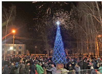
Праздник в Павловске

Местная администрация города всегда тщательно готовится к проведению праздника, результат – отличное настроение горожан, благодарные отзывы.