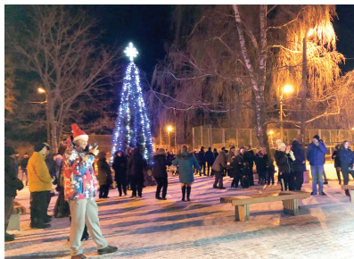
Гулянье в пос. Динамо

Традиция проводить праздники на свежем воздухе вместе с друзьями и соседями давно прижилась в Павловске. Многие жители с удовольствием собираются на площади у административного здания в Песчаном переулке, чтобы весело и активно отпраздновать наступивший Новый год.