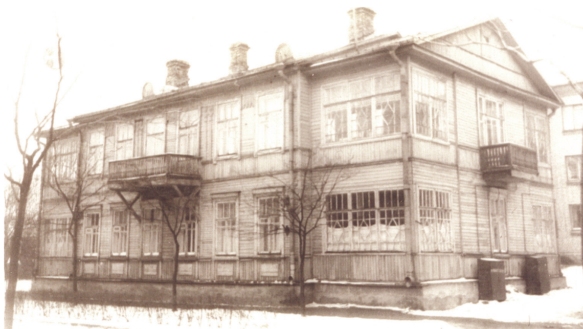
Дом Петерсенов-Цауне (1-й этаж восходит к дому Софии Шнейдер) по адресу: Песчаный переулок (улица Розы Люксембург), 9