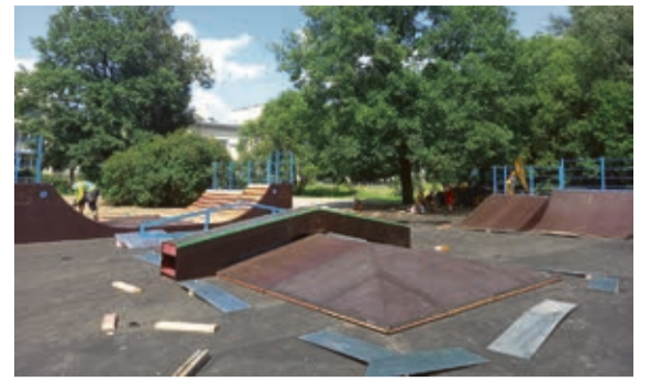
Ул. Просвещения, участок 1