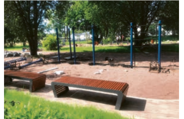
Ул. Госпитальная, д. 24