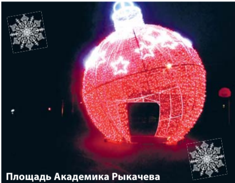
Площадь Академика Рыкачева