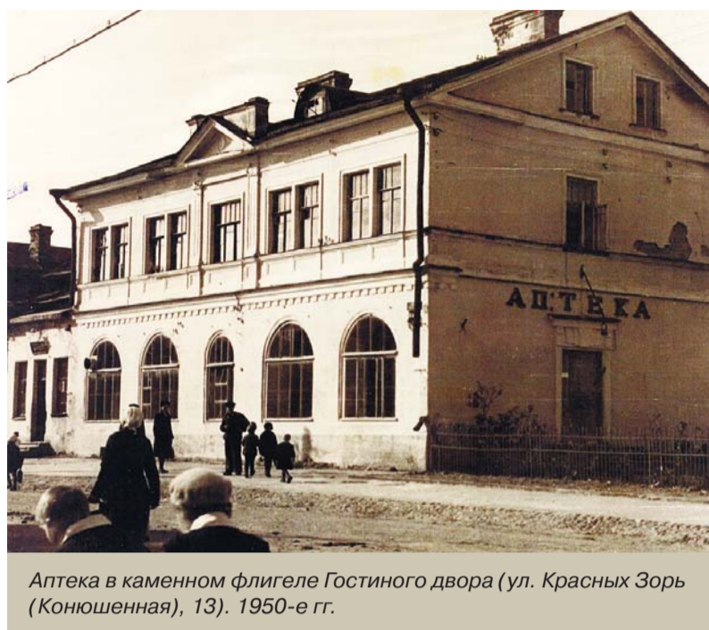
Аптека в каменном флигеле Гостиного двора (ул. Красных Зорь (Конюшенная), 13). 1950-е гг.