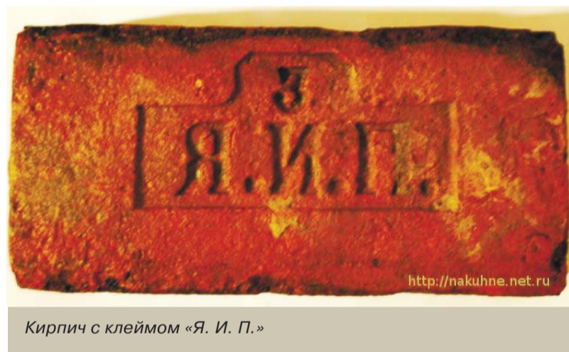
Кирпич с клеймом «Я. И. П.»

здание Царскосельского уездного казначейства. В 1914 году кирпичи с клеймами «Я. И. П.» использовались для реконструкции Александровского дворца.