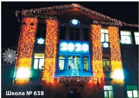
Школа № 638