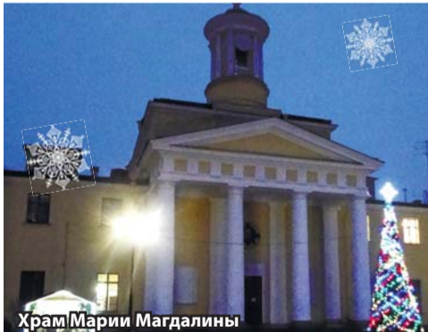
Храм Марии Магдалины