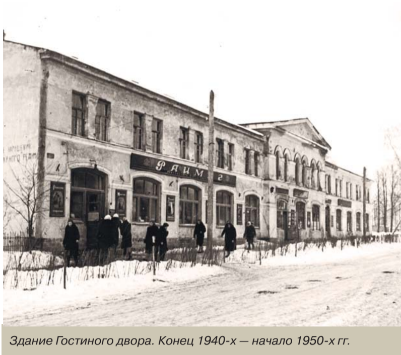
Здание Гостиного двора. Конец 1940-х — начало 1950-х гг.