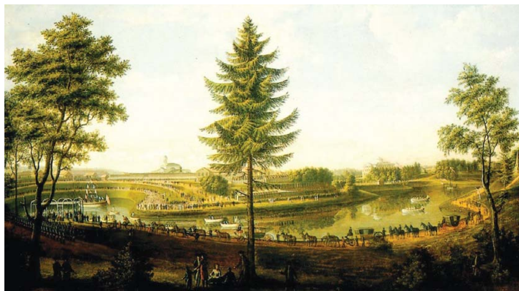
И. Я. Меттенлейтер. Гуляние на Мариентальском пруду. 1790-е годы

Сергей Выжевский, Музей истории города Павловска (ЦККД «Павловск»)