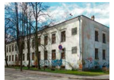
Заброшенное здание фабрики «Весна». 2012 г.