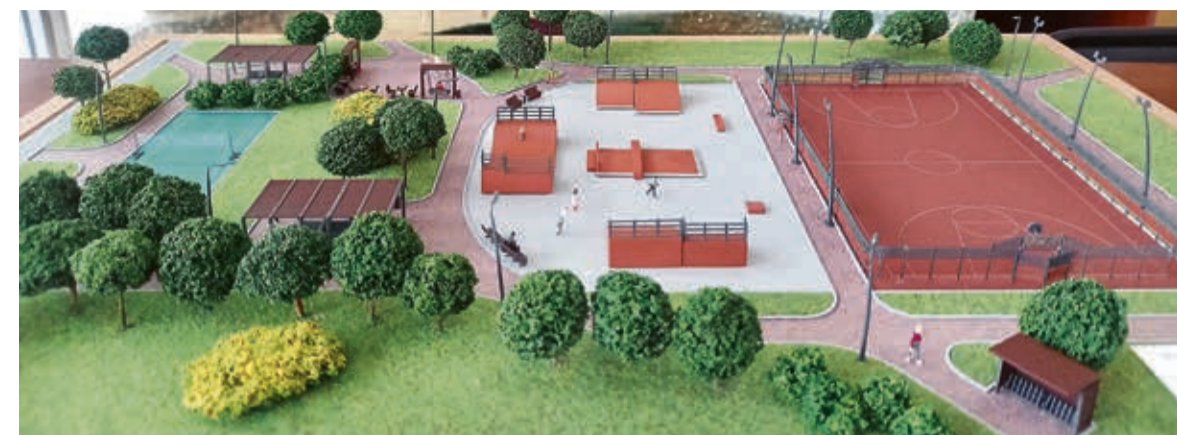
Макет площадки на ул. Просвещения, участок 1

Напомним, что проект «Формирование комфортной городской среды» — это не только благоустройство, но и доступность объек-