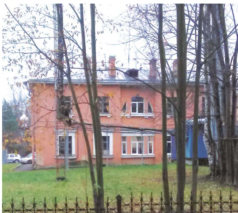
Тыльный фасад здания пожарной части. Современный вид. По центру можем видеть перестроенный вход в храм Святой Троицы