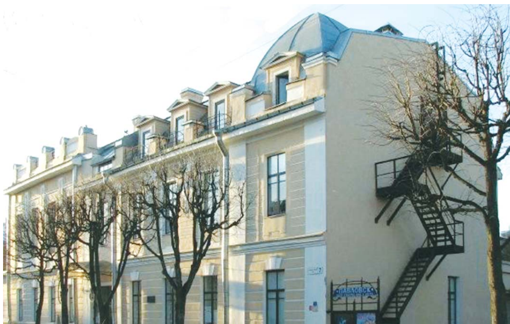
Центр культуры, кино и досуга «Павловск»

партнерах. Основу виртуального филиала великой русской сокровищницы искусства составляет медиатека, включающая более 500 мультимедийных программ и фильмов. Там можно найти видеофильмы с профессиональными комментариями искусствоведов, интерактивные программы для взрослых и детей.