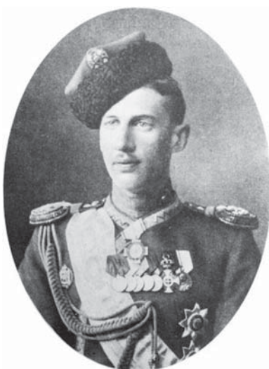
Последний владелец Павловска князь императорской крови Иоанн Константинович Романов