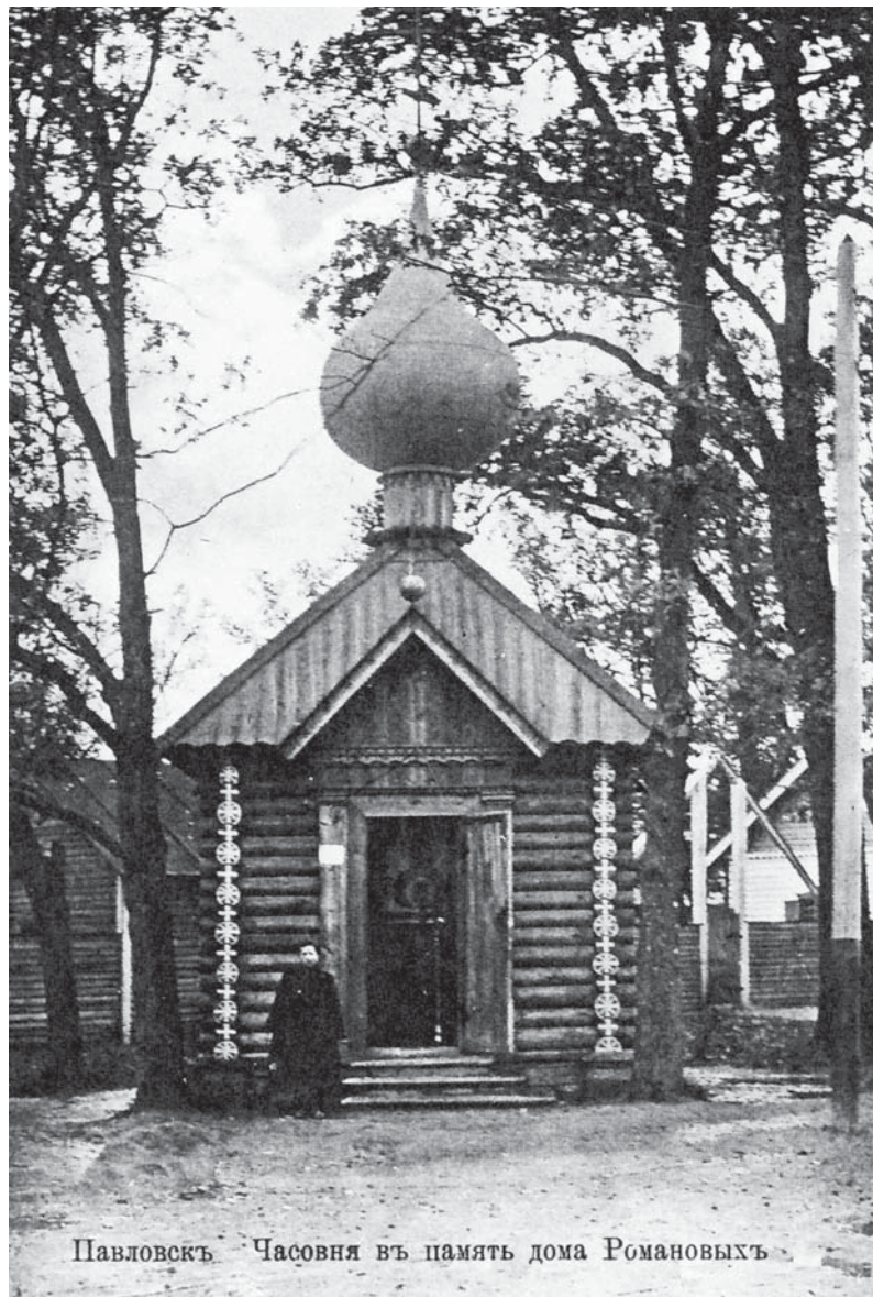
Павловск. Часовня в память дома Романовых. Фотография на открытке. До 1917 года

После Февральской революции 1917 года о завершении строительства храма уже не могло быть и речи, а в июле 1918 года под Алапаевском приняли муче-