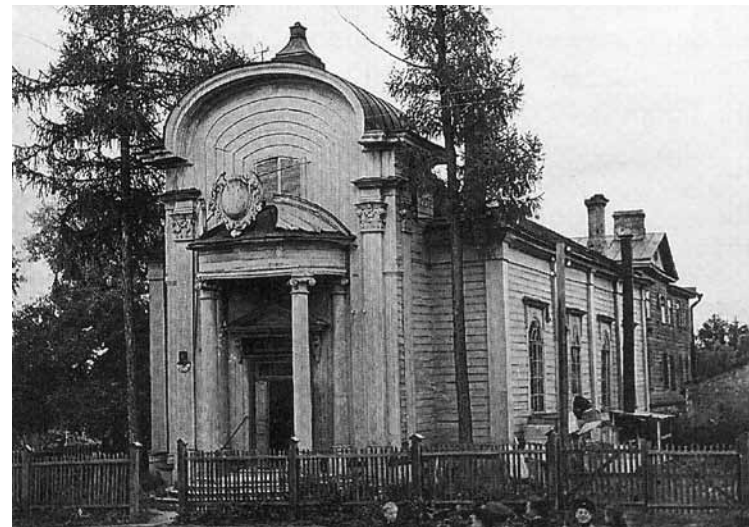
Здание бывшей кирхи в 1956 году