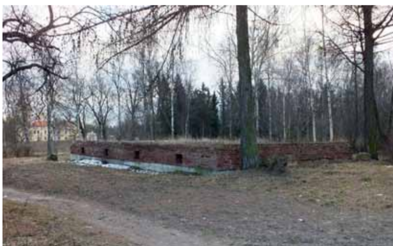
Разрушающийся фундамент, на котором должны были восстанавливать кирху. Тропинка на переднем плане — начальная часть Медвежьего переулка

ностью разобрано. Для восстановления кирхи заложили новый фундамент, но на этом дело и застопорилось, как говорят, из-за недостатка средств. Городская легенда гласит, что здание брались восстанавливать финны, но за зиму завезенные ими материалы разворовали, на что финны обиделись и отказались от всяких дальнейших планов.