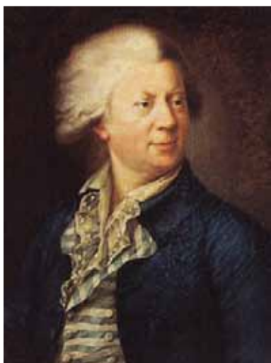
С. Щукин. Портрет Ю. М. Фельтена. 1786

В 1975 году деревянную кирху включили в число памятников архитектуры, к концу 1970-х годов здание освободили от производства, но нового назначения оно так и не получило, несколько раз горело и в 1992 году было пол-