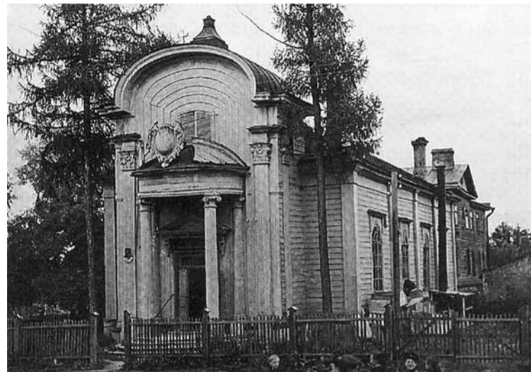
Здание бывшей кирхи в 1956 году