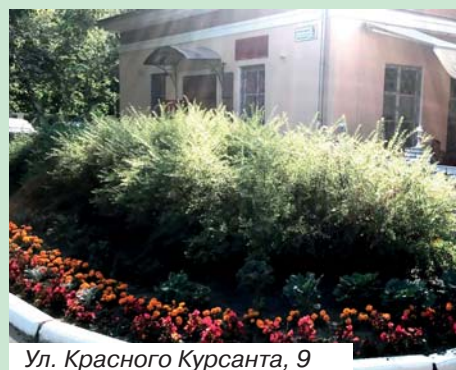
Ул. Красного Курсанта, 9