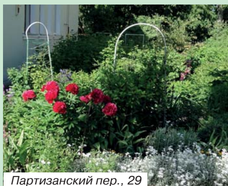
Партизанский пер., 29

Благодарим всех участников за большую работу, которую вы бескорыстно делаете на благо нашего города. Вы меняете облик нашего родного Павловска, приносите радость всем жителям и гостям города.