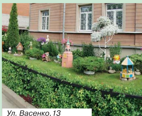
Ул. Васенко, 13