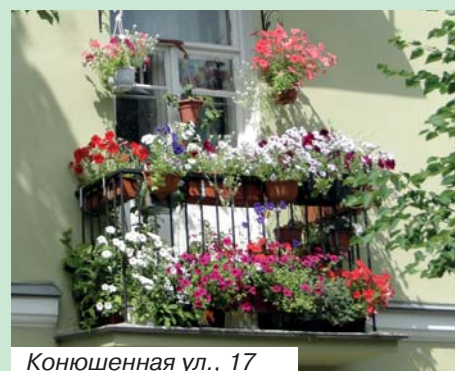
Конюшенная ул., 17