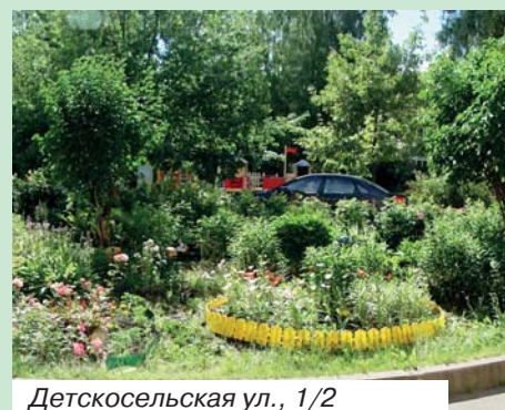
Деткосельская ул., 1/2