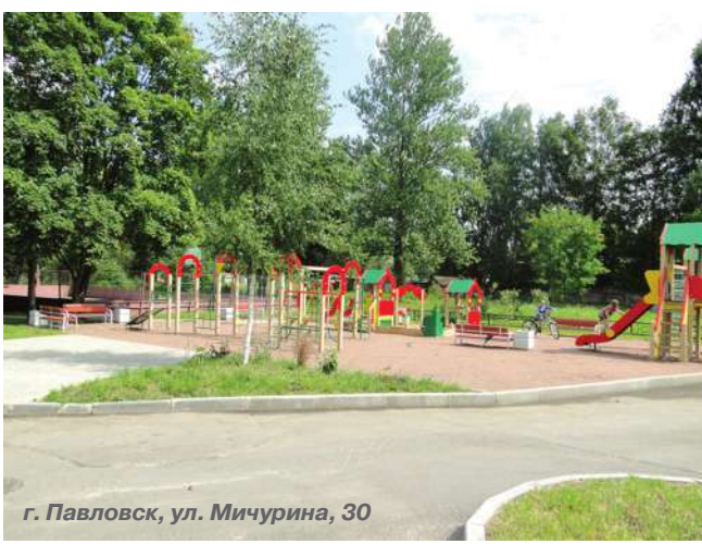
г. Павловск, ул. Мичурина, 30