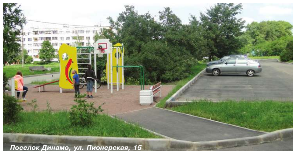
Поселок Динамо, ул. Пионерская, 15