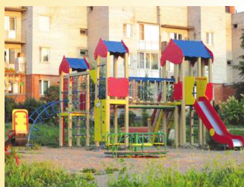
г. Павловск, поселок Динамо, ул. Пионерская, дома №№ 15, 17