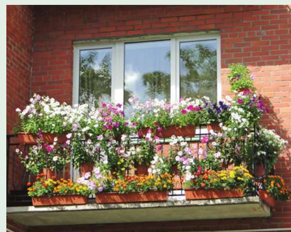
ул. 1-я Советская, д. 18 (Е.А. Коньшина)