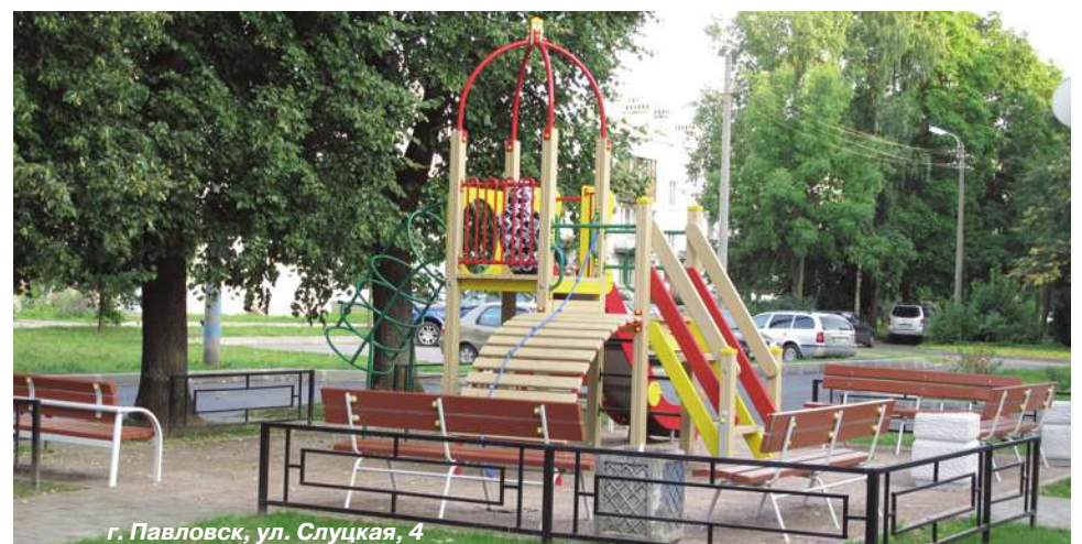
г. Павловск, ул. Слущкая, 4