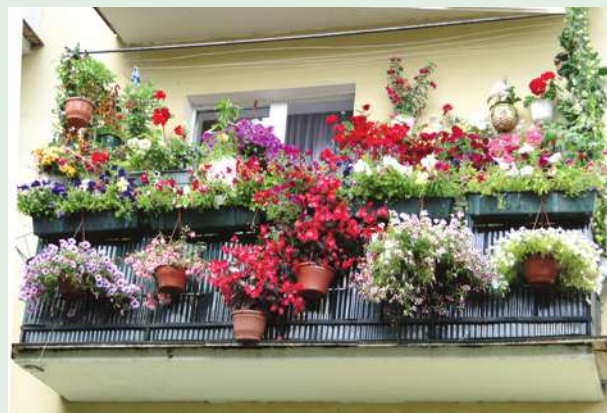
ул. Слуцкая, д. 4 (З.И. Краснова)