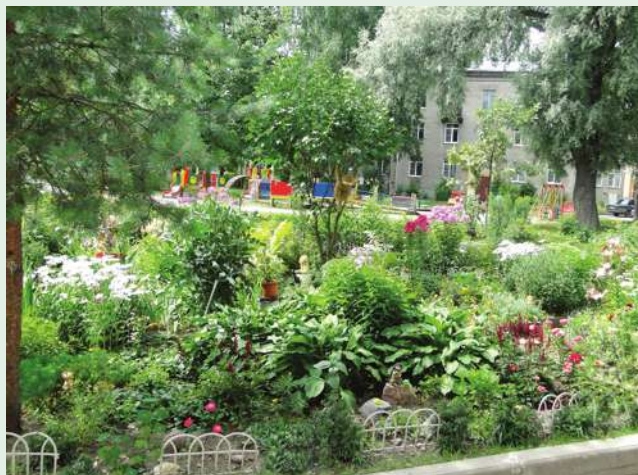
ул. Детскосельская, д. 1/2 (Т.Н. Глинская)