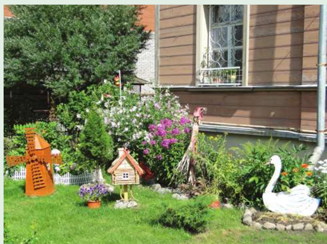
ул. Васенко, д. 13 (Н.Г. Абрамова)