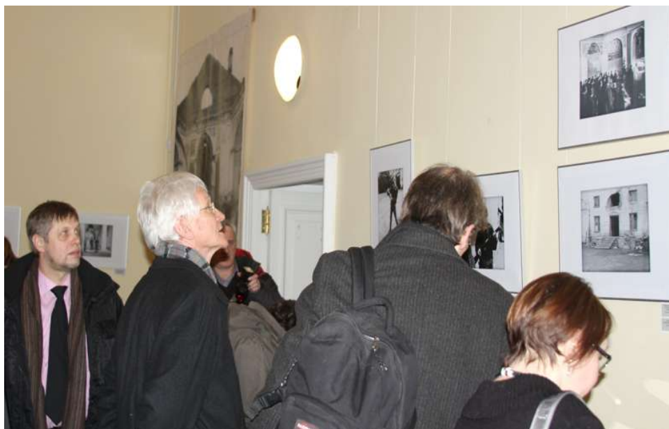
На открытии выставки.