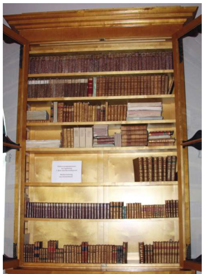
Возвращенные книги в шкафу Библиотеки России.

парадный плац дворца, чтобы зарегистрироваться по приказу захватчиков. И фашистский флаг, реющий над куполом Павловского дворца. Да, смотреть на это крайне тяжело. Но это было, и поэтому документальные свидетельства важны для истории, для потомков. Интересно, что в Зале Мира фашисты устроили церковь, что удостоверяет уникальная фотография, на которой присутствует на литургии в 1943 году генерал Эстебан Инфантес. Перед павильоном России во время войны фашисты устроили свое кладбище. На нем стоял мемориальный знак из известняка буквой "П". Частично эти камни сохранились, они также представлены на