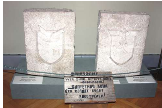
Мемориальные камни с немецкого кладбища.

парадный плац дворца, чтобы зарегистрироваться по приказу захватчиков. И фашистский флаг, реющий над куполом Павловского дворца. Да, смотреть на это крайне тяжело. Но это было, и поэтому документальные свидетельства важны для истории, для потомков. Интересно, что в Зале Мира фашисты устроили церковь, что удостоверяет уникальная фотография, на которой присутствует на литургии в 1943 году генерал Эстебан Инфантес. Перед павильоном России во время войны фашисты устроили свое кладбище. На нем стоял мемориальный знак из известняка буквой "П". Частично эти камни сохранились, они также представлены на