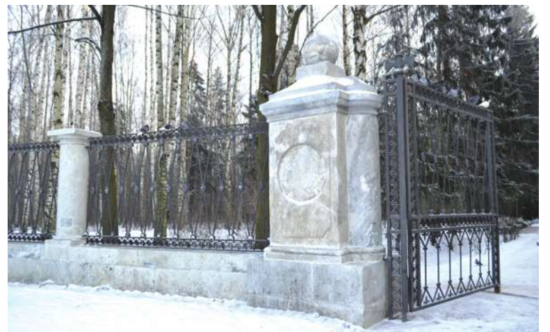
Завершились работы по реставрации Мраморных ворот и решетки на входе в парк со стороны Привокзальной площади.

Привокзальный и Старошалеинский пруды и обеспечивает его водой. Правда, в холодное время года доступ воды в каскад перекрывается.