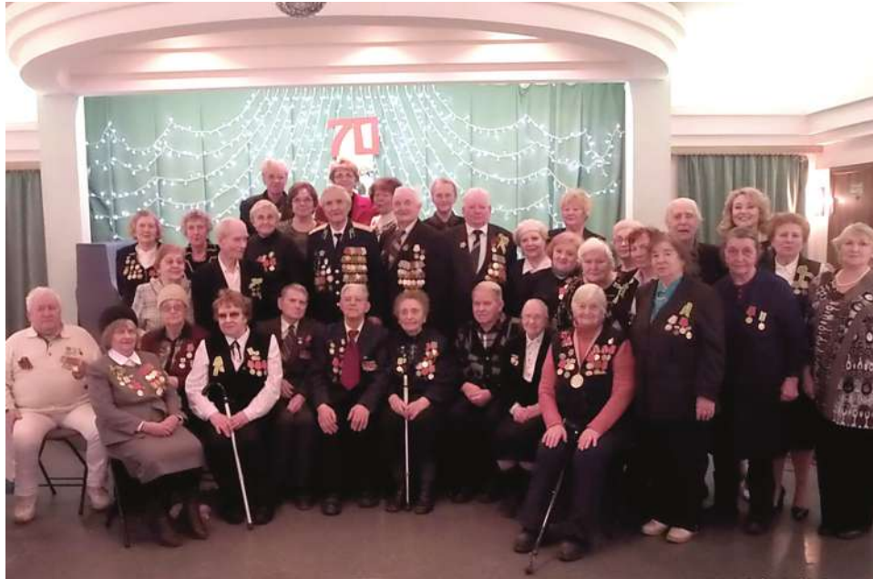
На торжественном приеме в ЦККД.