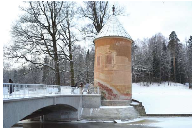
Отреставрированный мост-плотина "Пиль-башенный".

Напомним, что Большой каскад Павловского парка был построен Чарльзом Камероном в 1786–1787 гг. В то время это была груда камней с четырехугольной формы трубой в центре. В 1791 г. великая княжна Мария Федоровна поручает переделку каскада Винченцо Бренна. К 1794 г. – это уже балкон из пудожского камня с балюстрадами и вазами. Существенному ремонту Большой каскад подвергся в 1820 и в 1940 гг. С тех пор архитектура сооружения не менялась. В годы Великой Отечественной войны каскад не пострадал, лишь была испорчена подземная труба. При обследовании в 1990 г. было установлено: открытый канал и колодец заилены, откосы оползли, кладка повреждена, а крепления из камня частично разрушены. Позже, в 2007 г., пострадала и балюстрада. И вот благодаря международному сотрудничеству проект реставрации каскада реализован. Также в рамках работ на каскаде в 2012 г. была отремонтирована плотина, которая соединяет