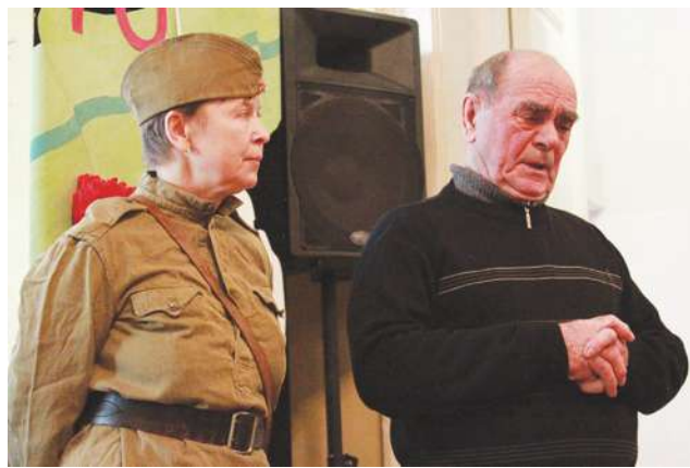
Вспоминаю фронтовое детство.

Традиционная интерактивная встреча памяти "Праздник в блокадной школе", посвященная 70-летию полного освобождения Ленинграда от вражеской блокады, прошла в Доме детского творчества "Павловский".