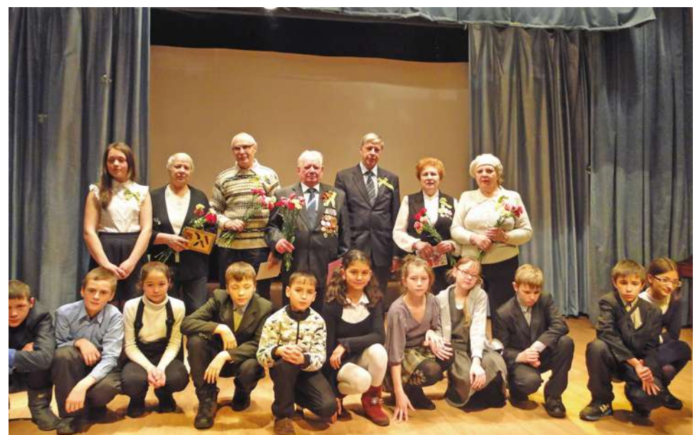
Участники уроков мужества.