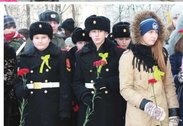
На фото: участники митинга у братского захоронения "Скорбящая" и у памятника Воину-освободителю.