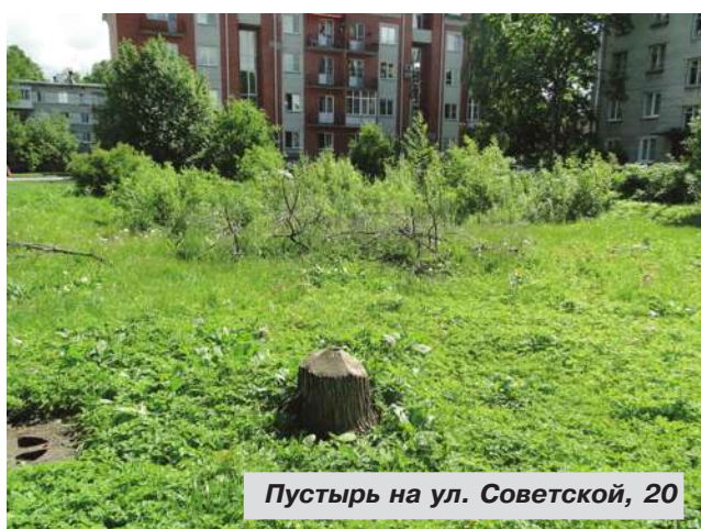
Пустырь на ул. Советской, 20

– Земельные участки, на которых расположены указанные дома, находятся в собственности ООО "Квинт-Инвест". Информации от собственника о дальнейшем использовании земельных участков, сроках начала строительства объектов недвижимости в администрацию Пушкинского района не поступало.