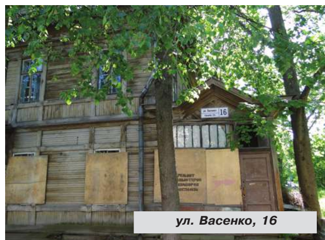
ул. Васенко, 16

● Ул. Васенко, дом № 16. Здание вместе с земельным