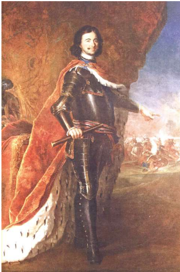
Антуан Пэн. Портрет Петра Великого.

Интересна история создания этого живописного полотна. Портрет написан известным европейским мастером первой половины XVIII века, придворным художником трех прусских королей Антуаном Пэном. Известно, что в 1716 году Петр дал сеансы Антуану Пэну в городе Хафельберге, куда русский царь прибыл для общения с прусскими королями. В походном журнале Петра I за 1716 год под датой 14 ноября оставлена запись: "Его величество кушал у короля и списывали персону...". За два сеанса был написан погрудный портрет. Для нас живописное полотно имеет особую ценность – ведь это прижизненный портрет императора. Потом, по каким-то причинам сравнительно