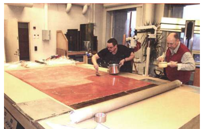
Процесс подготовки к дублированию картины на новый холст при помощи вакуумного стола низкого давления.