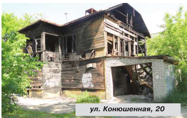
ул. Конюшенная, 20

● Дом № 20 на ул. Конюшенной. В 2013 г. ОАО "Фонд имущества Санкт-Петербурга" провел аукцион с целью продажи двух нежилых помещений в указанном здании общей площадью 228,5 кв. м. Победителем торгов – физическое лицо. Информации от собственника о дальнейшем использовании этих помещений и о сроках проведения ремонта в администрацию Пушкинского района не поступало. В апреле