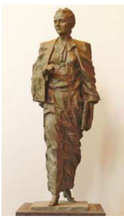
Проект авторского коллектива скульпторов Н.Н. Анциферова, А.А. Анянueva и архитекторов В.А. и Н.В. Энгельке.