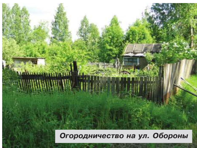
Огородничество на ул. Обороны

– Расскажите, пожалуйста, о судьбе огородничества в Заречной части города Павловска по ул. Обороны.