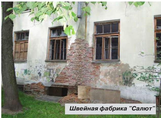
Швейная фабрика "Салют"

– Земельный участок, расположенный по адресу: г. Павловск, ул. Васенко, д. 3, лит. А (территория бывшей фабрики "Салют"), находится в собственности ЗАО "Салют-Престиж". По информации ЗАО "Салют-Престиж", в настоящее время ведется разработка и согласование проектной документации на строительство жилого комплекса на указанном земельном участке. Планируемые сроки начала строительных работ – IV квартал 2015 г.