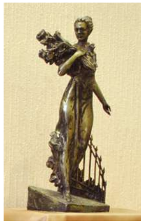
Проект авторского коллектива скульпторов В.А. Баркова, И.Н. Литвинова и архитектора Е.Ю. Черепашина.

Вячеслав ВАСИЛЬЕВ, председатель координационного совета общественного движения "Красивый Павловск"