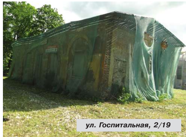
ул. Госпитальная, 2/19

● Госпитальная ул., дом № 2/19. 3 июня Фонд имущества провел аукцион по продаже указанного здания вместе