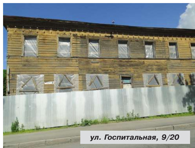
ул. Госпитальная, 9/20

● Госпитальная ул., дом № 9/20. Здание вместе с земельным участком было продано Фондом имущества на торгах 28 ноября 2012 г. Собственником объекта является физическое лицо. Учитывая, что здание относится к числу вновь выявленных объектов культурного наследия, в настоящее время собственник осуществляет разработку и согласование проектной документации на него с КГИОП. Планируемые