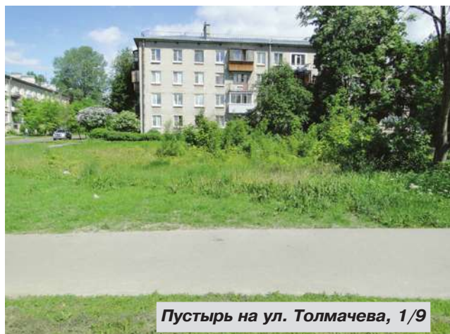
Пустырь на ул. Толмачева, 1/9

– Планируется ли строительство домов по адресам: ул. Толмачева, дом № 1/9, ул. 1-я Советская, дом № 20?