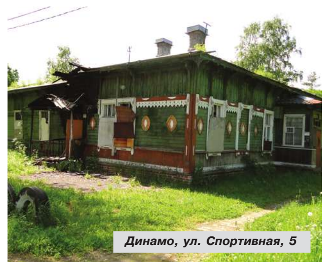
Динамо, ул. Спортивная, 5

● Спортивная улица, дом № 5. Здание расселено, планируется продажа его на торгах Фонда имущества.