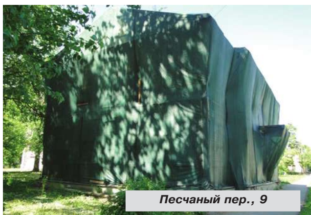
Песчаный пер., 9

● Песчаный пер., дом № 9. В связи с невыполнением